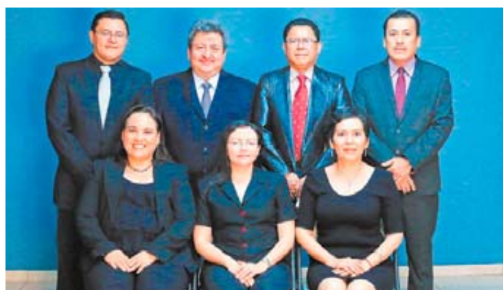
Miembros nefrólogos de oriente. De izquierda a derecha, sentadas: